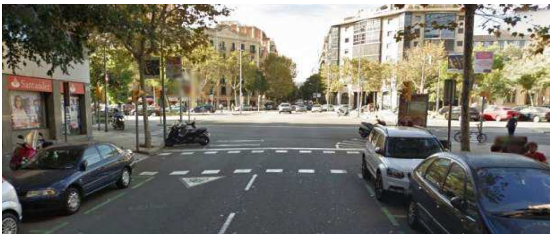
Imagen de la confluencia de las calle Rocafort y la avenida Roma, en el distrito del Eixample (Barcelona).