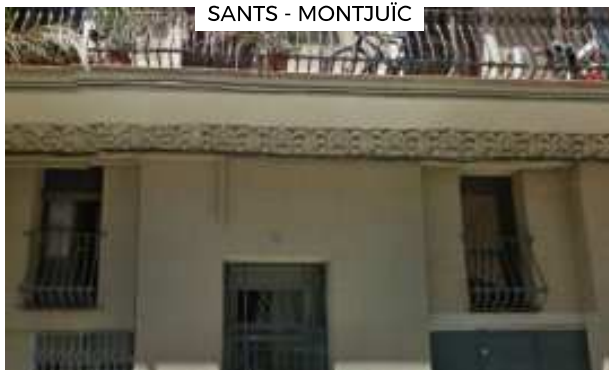
SANTS - MONTJUÏC