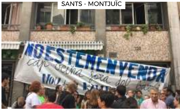
SANTS - MONTJUÏC